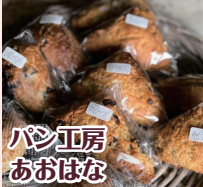
パン工房 あおはな

長崎県内外から、 人気のお店を職員が 選び出展頂きました。 この機会にぜひ、 ご賞味ください！