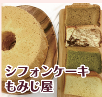
シフォンケーキ もみじ屋