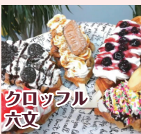
クロワッフル 六文