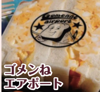
ゴタンね エアポート