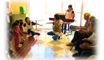
隣接する保育園の園児さんと交流