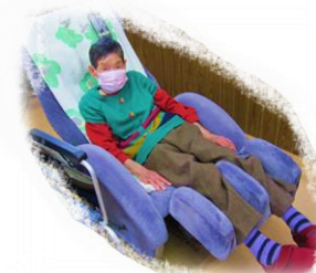
マッサージチェア利用中のご利用者