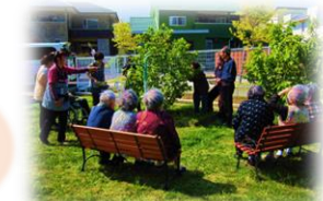
敷地内の畑でさくらんぼ収穫中

近所の公園に散歩したり、園児さんが遊びに来てくれたりと、地域交流の場を大切にしています。又、敷地内の畑で作ったお芋やさくらんぼを収穫、ご利用者におやつとして食べていただく地産地消にも取り組んでいます。