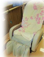
マッサージチェア

身体を温めたり、揉みほぐしたりすることによってリラックス効果を高めます。特に... マッサージチェアは大人気です♪