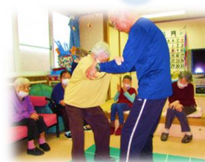
スクエアステップ実施中の様子