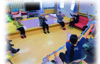
集団体操実施中の様子

道具を用いたり歌唱を交えながら楽しんで、笑顔で参加していただいています。又、週1回講師によるスクエアステップも開催していますので、身体のリハビリにもなります！